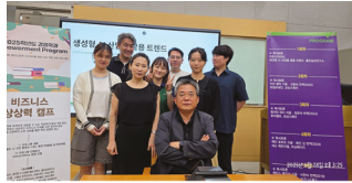
"비즈니스 상상력 캠프"